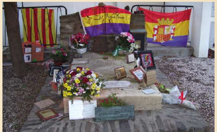
Tombe d'Antonio Machado à Collioure.