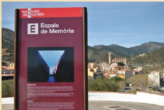
Mémorial Walter Benjamin « Passages » à Portbou.