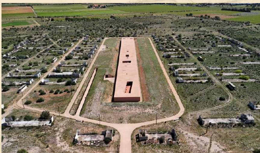
Vue aérienne du Mémorial du Camp de Rivesaltes.